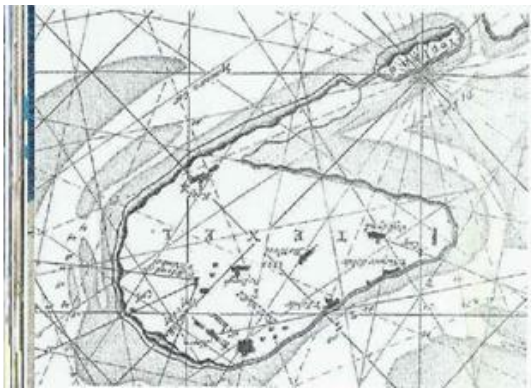
Afb. 1. Texel en Eierland