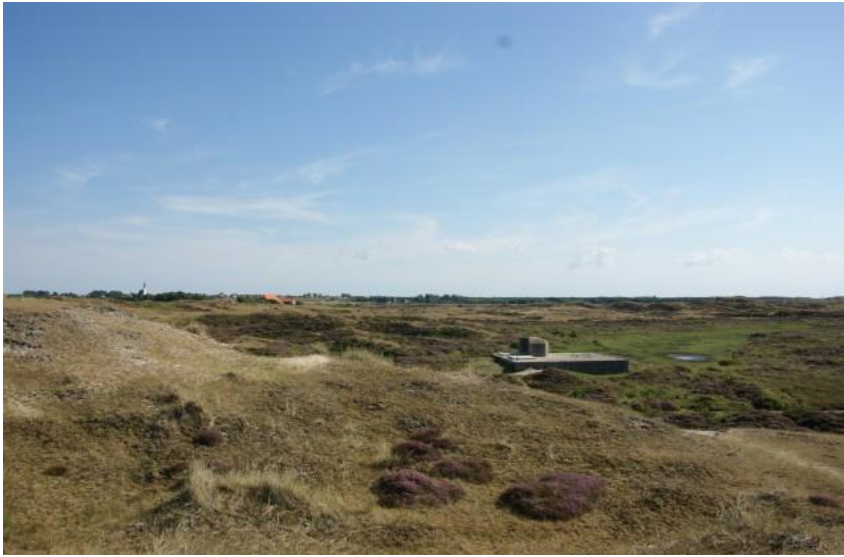
Afb. 1. Geschutemplacement in de Bollekamer

In de toenmalige zeereep stonden drie meetposten. Twee zijn er door kustafslag in zee verdwenen,