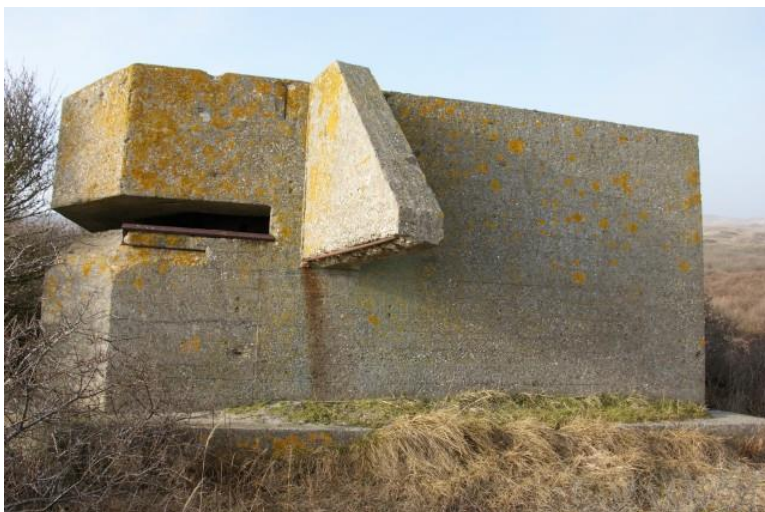
Afb. 2. De meetpost

De bezetters vonden deze manier van werken te ingewikkeld voor een kustbatterij en haalden het